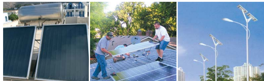
■ Małe panele zasilające oświetlenie ulic